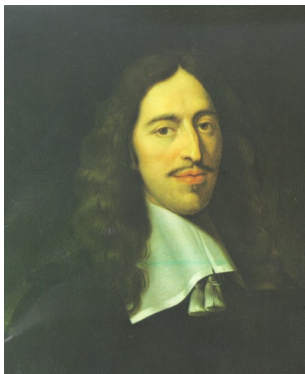
Johan de Witt

Nadat een aantal provincies in het noorden van de Nederlanden zich had los gevochten van de Spanjaarden, besloten deze landjes samen een republiek te vormen. De Oranjes, die erg belangrijk waren geweest in de oorlog, werden legeraanvoerder in dienst van de regering. Ze kregen de titel stadhouder, woonden in mooie paleizen, maar hadden officieel niets te zeggen. Natuurlijk hadden ze wel heel veel invloed en ze waren razend populair bij het volk. Vaak was er ruzie tussen de regenten (politici), die het voor het zeggen hadden en de stadhouder. Twee keer had zo'n ruzie een dodelijke afloop. De eerste keer was dat Johan van Oldenbarnevelt, die in 1619 op het Binnenhof werd onthoofd. De tweede keer was dat Johan de Witt, die samen met zijn broer in 1672 door een woedende menigte werd doodgeslagen voor de Gevangenpoort. De machtigste Oranje was Willem III. Behalve stadhouder, werd hij in 1688 ook koning van Engeland.